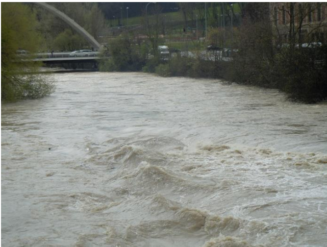
Presa de Santa Engracia el 12-04-2018

En las fotos de la presa de Santa Engracia en la avenida del 12/04/2018 la presa casi ha desaparecido, sólo se aprecia una turbulencia que desaparecerá en caudales mayores. La lámina de agua la crea el remanso del puente de Santa Engracia.