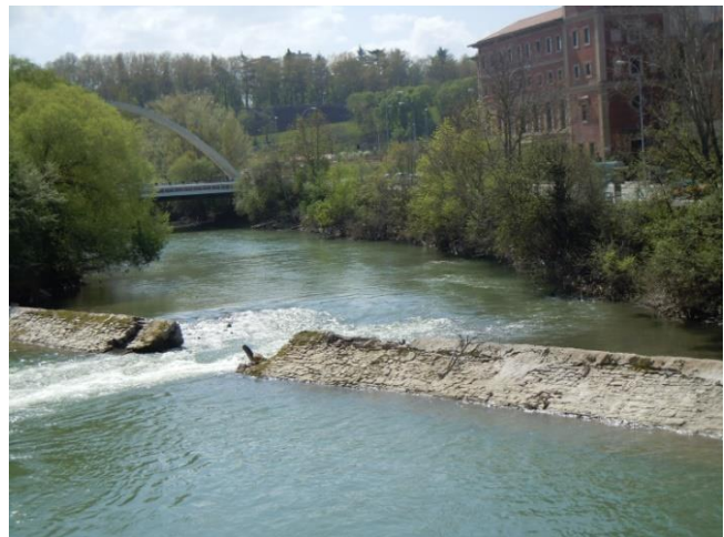
Presa de Santa Engracia el 20-04-2018

Esas fotos son un ejemplo, creo que elocuente, de que esta presa no afecta a las avenidas. En los programas informáticos del funcionamiento del río se aprecia claramente cuáles son las secciones críticas que crean, en cada tramo del río, la cota de la inundación y en el caso del Arga en Pamplona, nunca son las presas.