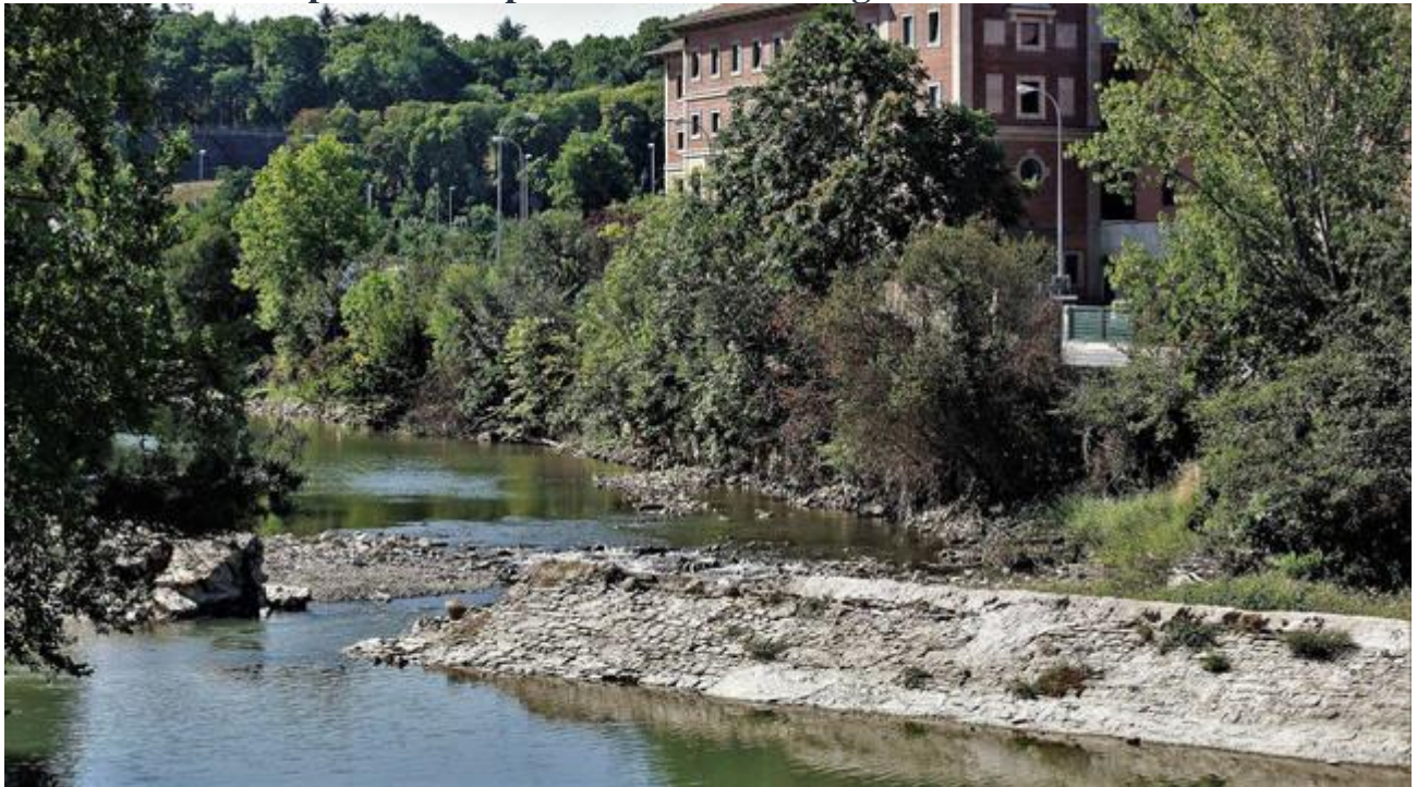
Vista del azud de Santa Engracia, con su parte central derribada desde el invierno de 2017.

Los regionalistas dicen que Bildu remitió a la CHE un plan para derribar los azudes "mientras prometía reparar el de Santa Engracia"