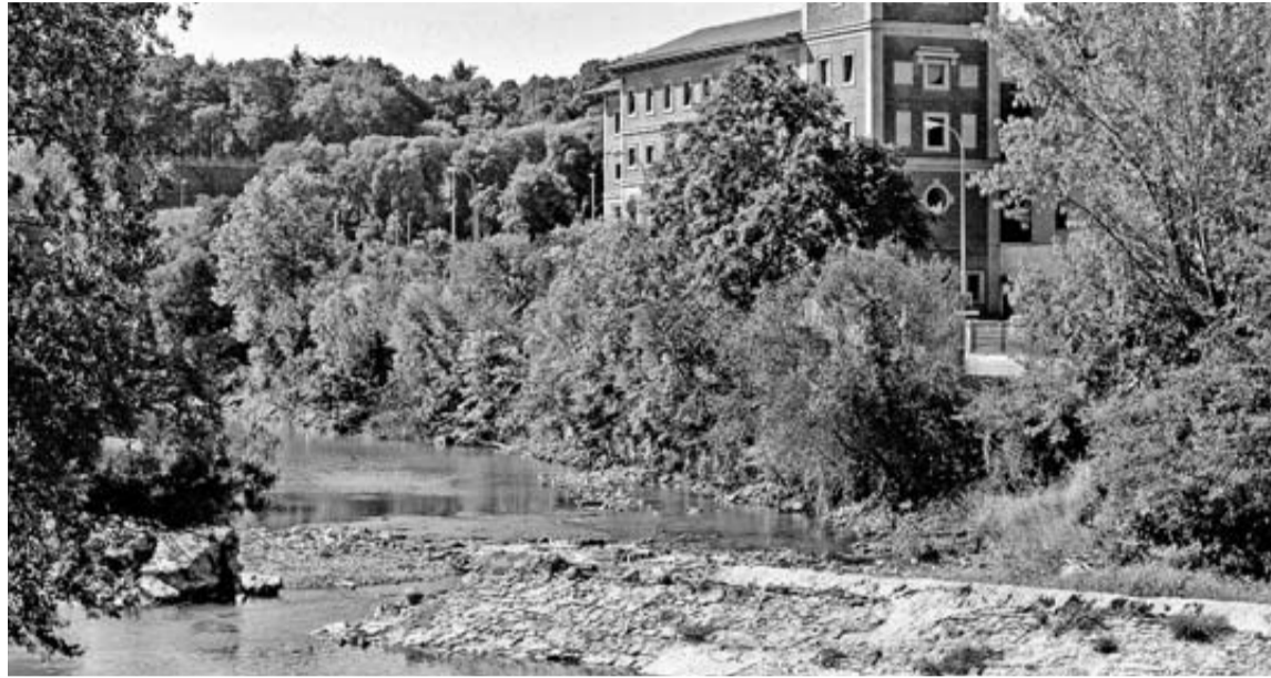
Vista del azud de Santa Engracia, con su parte central derribada desde el invierno de 2017

Ahora, un informe del comisario de aguas de la entidad propone que se retiren los restos de la estructura dado que el azud "está en desuso, limita la capacidad de desagüe del cauce y constituye una ruptura en la continuidad longitudinal del río Arga". Lo mismo que dijo el Gobierno de Navarra