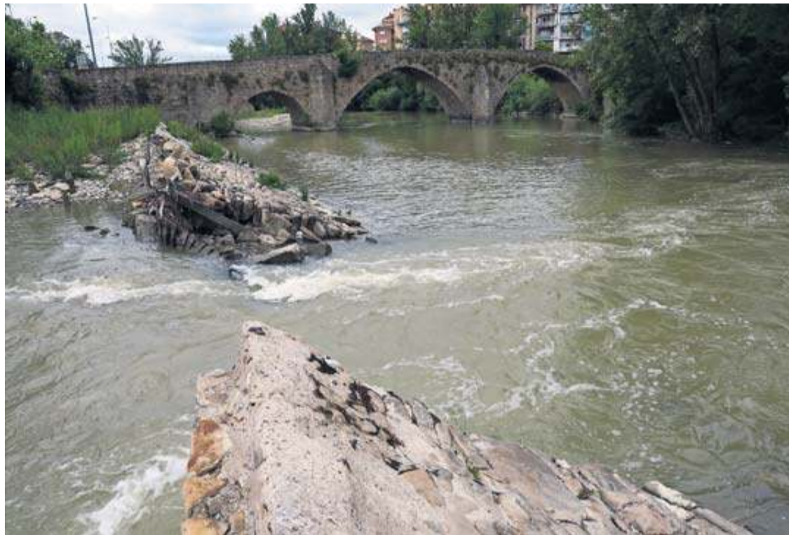
Imagen del azud de Santa Engracia de junio de este año, con el centro dañado desde invierno de 2017 BUXENS

Y contra esto quiere alegar NA+, porque, según dijo ayer tiene, la presa tiene un valor histórico puesto que su origen se remonta al siglo XIII, además de social y lúdico ya que el agua embalsamada permite la práctica de remo de la mano de un club con presencia en la competición nacional, y la pesca. Y añadió que, según un informe técnico de ingeniería, no incide en el aumento de las inundaciones. "También hay motivos medioambientales porque su rotura está afectando al meandro, favorece la propagación de plantas alóctonas y compromete la estabilidad de la ripa, como demuestra el Modelo de